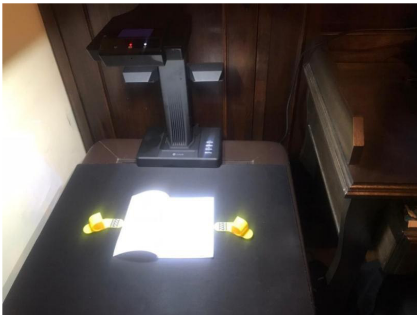
Figura 2 - Scanner óptico